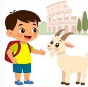
Tito encontra a goat em Roma.