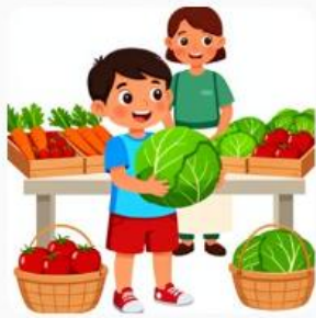
Tito ajuda com a cabbage no mercado.