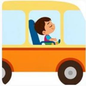
Tito dorme no ônibus.