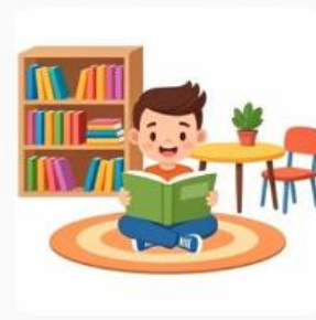
Tito na library com seu book.